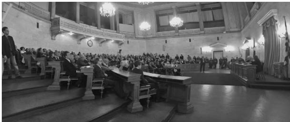
Γενική άποψη της αίθουσας του Μεγάρου της Παλαιάς Βουλής.