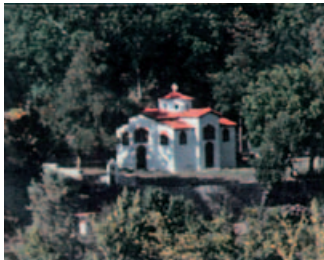
Ιερός Ναός Ζωοδόχου Πηγής Φουρνά

Α. Ο Φουρνάς ήταν ένα από τα σημαντικότερα και πολυπληθέστερα χωριά (κεφαλοχώρι) της περιοχής των Αγράφων. Βρίσκεται κοντά στα όρια των νομών Καρδίτσας και Φθιώτιδας, κατέχει το βορειοανατολικό τμήμα του Νομού Ευρυτανίας και κείται στη δυτική πλαγιά του λόφου του Προφήτη Ηλία. Έχει υψόμετρο (στην πλατεία) 860 μ.. Τα τελευταία σπίτια κοντά στην κορυφή του λόφου ξεπερνούν τα 1000 μ.