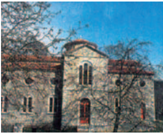
Ιερός Ναός Αγ. Νικολάου Βράχας

Βράχα. Ένα όμορφο χωριό που απλώνεται στις ανατολικές πλαγιές του όρους Λελούλη (υψ. 1350 μ.) με θαυμάσιο φυσικό περιβάλλον, ανθρώπους εργατικούς και φιλοπρόόδους, δημιουργικούς και φιλοπάτριδες. Παρότι οι σεισμοί του Φεβρουαρίου του 1966 επέφεραν φοβερές καταστροφές στο χωριό και οι Βραχηνοί αναγκάστηκαν να μετοικήσουν στο Σταυρό Φθιώτιδας –ύστερα από μεγάλες και χρονοβόρες διαδικασίες– δεν λησμόνησαν ποτέ τη γενέτειρά τους. Επανέρχονται στις γενέθλιες ρίζες τους, ανακαινίζουν ή ανεγείρουν «εκ βάθρων και θεμελίων» νέες κατοικίες καμωμένες με πολλή τέχνη και σύγχρονες. Το κα-