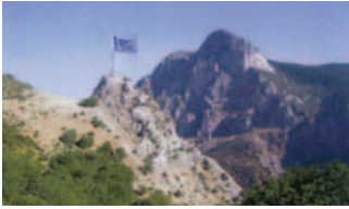
Η Ξακουστή Τσούκκα

Ασφαλτοστρωμένος δρόμος συνδέει τον Κλειτσό με τη Βράχα και Φουρνά. Έχει υψ. 780 μ.