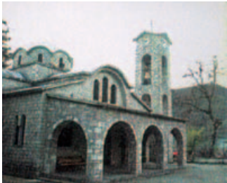
Κορίτσα Κλειτσού: Ιερός Ναός Αγ. Νικολάου του Νέου

Εικόνες άπειρης ομορφιάς και θεϊκού μεγαλείου!