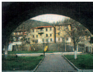
Πλατεία Μεσοχωρίου Κλειτσού

τικού διαμερίσματος του Κλειτσού: Πλάτανος, Μεσοχώρι, Κορίτσα, Κάλανος. Οι συνοικισμοί αυτοί βρίσκονται σε μικρή σχετικά απόσταση ο ένας από τον άλλο. Ο πέμπτος συνοικισμός, ο Μαυρόλογγος, απέχει από το Μεσοχώρι (κέντρο Κλειτσού) περίπου 14 χλμ και κείται σε μικρή απόσταση από τα όρια των νομών Ευρυτανίας και Καρδίτσας. Παλαιότερα υπήρχαν και μικρότεροι οικισμοί, όπως τα «Ζαγαριωταίικα», τα «Κατσιμπτραίικα», τα «Τσιριγκαίικα», τα «Ζιωβαίικα» και άλλοι, που διέμεναν κυρίως κτηνοτρόφοι και γεωργοί.