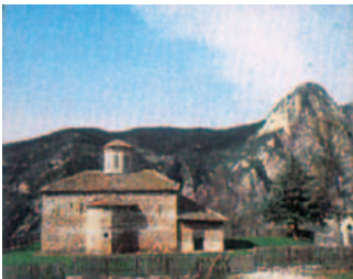
Ιερά Μονή Μεταμόρφωσης του Σωτήρος Βράχας

Κοντά στο Μοναστήρι της Βράχας, στη θέση «Κουκιά», έγινε στις 16 Μαΐου 1824 φονική μάχη, στην οποία βρέθηκαν αντιμέτωποι ο Γ. Καραϊσκάκης με τους Τούρκους. Οι Τούρκοι, ενισχυμένοι με τους Γιαννάκη Ράγκο , που συντάχθηκε με τους εχθρούς της πατρίδας γιατί επιθυμούσε διακαώς το αρματολίκι των Αγράφων, το Λιακατά και Ν. Στουρνάρη , κυνηγούσαν τον Καραϊσκάκη , για να τον διώξουν από το αρματολίκι των Αγράφων. Η μάχη κράτη-